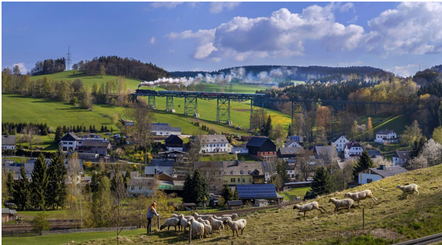
Aussichtsbahn auf dem Markersbacher Eisenbahnviadukt